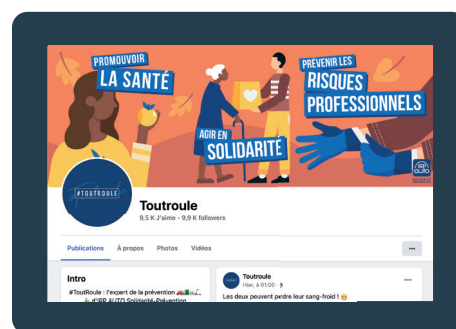
La page Facebook Toutroule