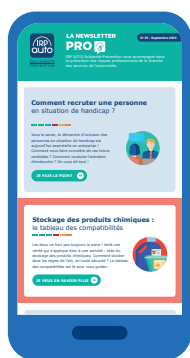
La newsletter PRO