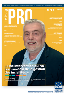
Le Mag PRO